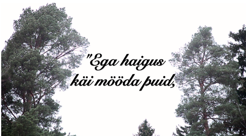
Kuvakaappaus sananlaskuvideosta. "Tauti ei liiku puita pitkin..."