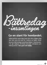
Idag är en bra dag -affischer (A4)