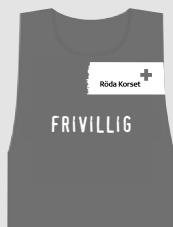
Västar för frivilliga