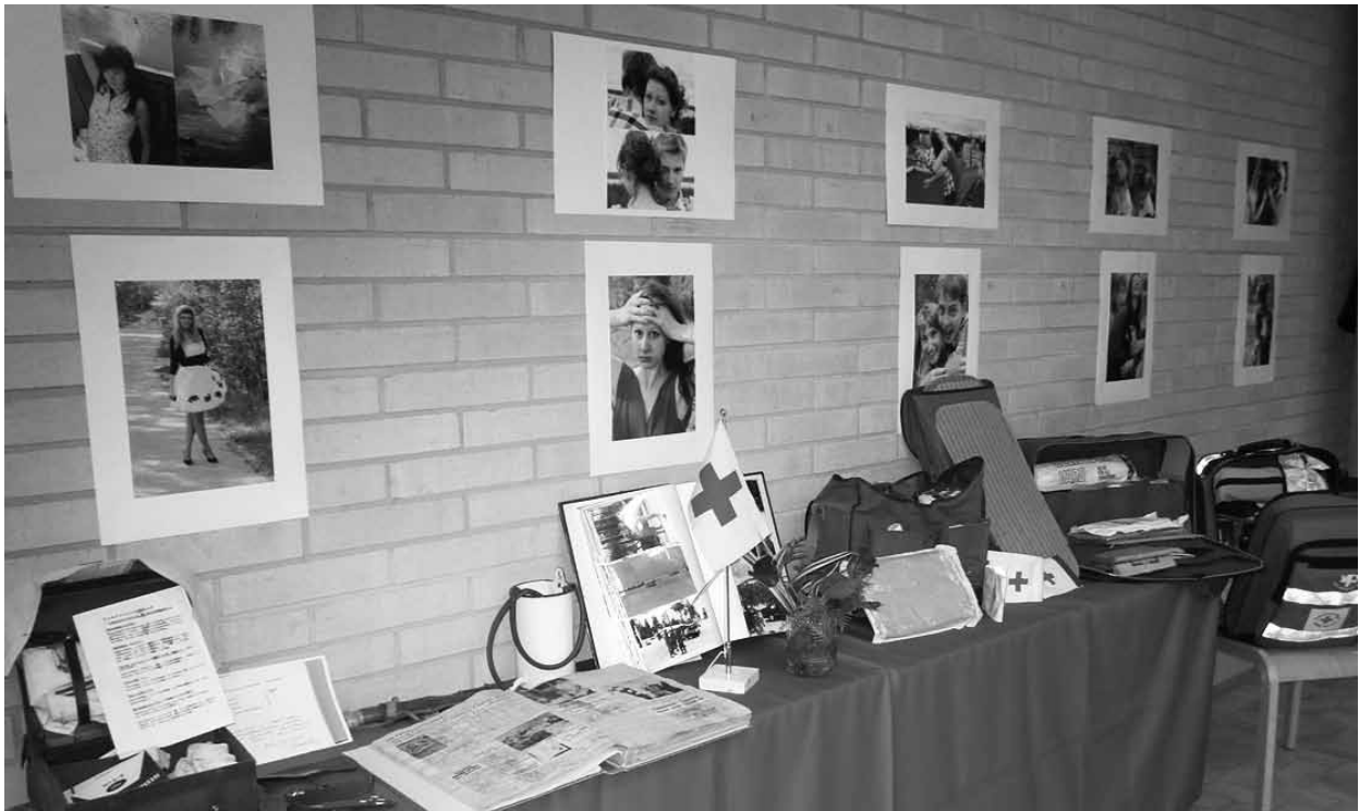
Esillä juhlassa oli myös ensiaputarvikkeita osaston alkuajoilta ja aikaisempien toimijoiden aarteistosta.

Kajaanin osaston toiminta alkoi virallisesti 10.2.1951, jolloin perustamiskokous pidettiin Kajaanissa. Osaston nimeksi rankattiin Suomen Punaisen Ristin Kajaanin osasto ja toimintaan liittyi välittömästi 22 edustajaa. Toiminnassa on vuosien saatossa ollut jopa 200 henkilöä erilaisten vapaaehtoistoimintojen muodossa, mm. ystävätoiminnassa, veripalvelussa, ensiapuryhmätoiminnassa, keräyksissä ja nuorisotoiminnassa.