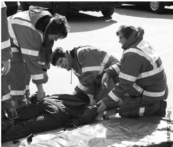
Pyhäjärven ea-ryhmä harjoittelee.

Tässä on nyt tuhannen taalan paikka kehittää ja vahvistaa ensiapuryhmätoimintaa osastoisamme. Osastoista toivotaan hankeryhmään 1-2 edustajaa ensiapuryhmästä ja osaston hallituksen edustaja.