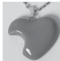
Sweetheart-tuoksukoru Kaunis sydämenmuotoinen kaulakoru on persoonallinen lahja. Korun toisella puolella on iso kolo, johon voit suihkauttaa lempituoksuasi. Osastohinta 24 € (ovh 30 €)