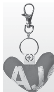
Sydän-avaimenperä Sydämellinen avaimenperä on tehty käytöstä poistetuista Punaisen Ristin keräysliiveistä ja lukko-osa on kierrätetty Bumerang avaimenperistä. Osastohinta 4 € (ovh 5,50 €)