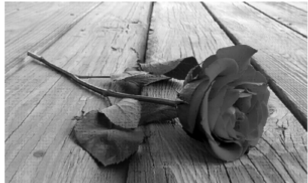
Jokaiselle oma ruusu.

nuu kuukauden sairaalajakson aikana ja vielä sen jälkeenkin. Näin sain itse kokea, kuinka tärkeää on ystäviltä saatu apu omassa hädässä.