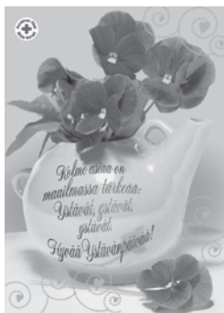
Ystävänpäiväkorttipakkaus Ystävänpäiväkortit 6 kappaleen pakkauksessa. Korteissa on postimaksu valmiiksi maksettu. Osastohinta 7,20 € (ovh 10,20 €)