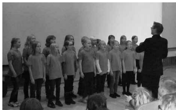
Kajaanin Keskuskoulun musiikkiluokan 3C:n oppilaat esiintyivät juhlassa.